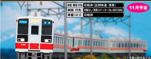
※写真は試作品です