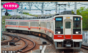
※写真は試作品です