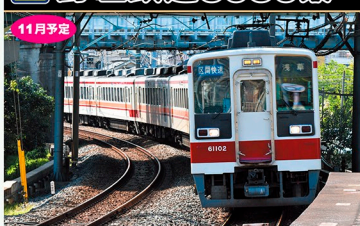
※写真は試作品です