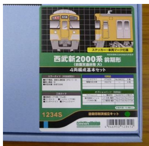
← 該当製品のラベル

※対応済み商品には、識別として商品名ラベルのJANコード上に丸印(●)のシールを貼付します。