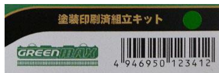
↑ 対応済を示す●シール

受付商品の正規対応版の返却につきましては、ご返送いただいた順に10月4日(木)より順次ご返却させていただきます。