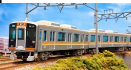
写真は試作品です。→

阪神9000系は、1996年に登場した急行系の通勤形車両で、「ジェットシルバー」と呼ばれた5201形以来のステンレス車体の車両です。2009年3月から実施されている阪神・近鉄相互乗り入れ運転開始に伴い、阪神なんば線・近鉄奈良線へ乗入最大10両編成で運転されています。乗入に伴い各種改造も受けています。