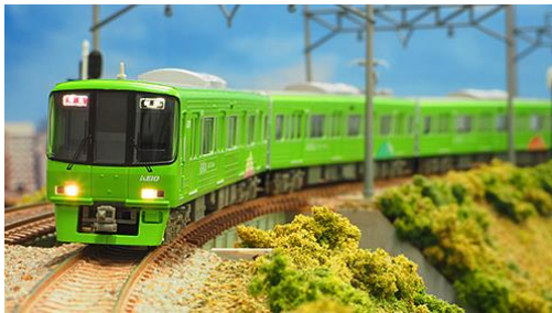
写真は前回製品です。 京王電鉄商品化許諾申請中

京王8000系は、京王の車両の中では初のVVVFインバータ制御を採用した車両で、1992年から1999年にかけて10両編成(6両+4両)14本・8両編成13本が製造されました。6000系の後継車として特急や準特急を中心に使用され、現在も京王を代表する主力車両となっています。 2005年までにパンタグラフがシングルアーム化され2008年頃までには方向幕がフルカラーLED化され、さらに2014年からは10両編成の中間先頭車の運転台部分を改造して客室化する等の大規模改修が行われました。 高尾山トレインは、2015年9月から運行されている車両で、かつての2000系を模したグリーンをベースに高尾山の四季等自然をイメージしたラッピングが施されています。