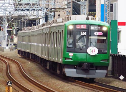
東京急行電鉄株式会社商品化許諾済

東急5000系は、2002年に8000系・8500系の置き換え用として導入された車両で、田園都市線を皮切りに目黒線に5080系が、東横線に5050系が次々と投入され、路線状況に合わせて6両編成から10両編成で運用されています。最新機器の採用により低騒音化と一層の省電力化が図られている他、JRE231系などの共通設計による車体部材の共通化が進められ、大幅なコストダウンが図られています。青ガエルラッピング編成は、東横線開通90周年を記念して、かつて東横線の主力車両として活躍した旧5000系の塗色を再現したもので、2017年9月から運行されています。