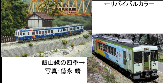
飯山線の四季→