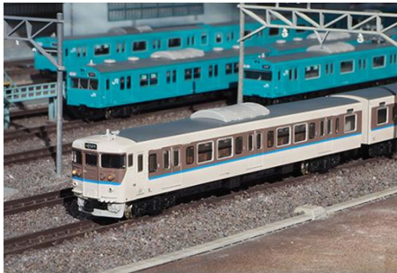
JR西日本商品化許諾済

JR西日本で活躍する113系のうち、状態の良い車両を対象に1998年から車体の大規模更新と座席の交換をはじめとする体質改善40N工事が施工されました。屋根の張り上げ化、ベンチレーターの撤去、側面窓ガラスの支持方式の変更や黒色サッシ化されている点が外観上の特徴です。薄茶色の塗装色をベースに、窓周りを茶色で塗り分け、同社のコーポレートカラーの青色のラインが入った更新色でカラーリングも一新されました。2009年からは地域に合わせた単色塗装に塗装変更されることとなり、順次更新色から地域色に塗装変更されています。製品は2004年頃に活躍していた京都総合運転所の灰色スカート装備のT1編成(No.50580)と黒色スカート装備のT2編成(No.50581)を製品化します。