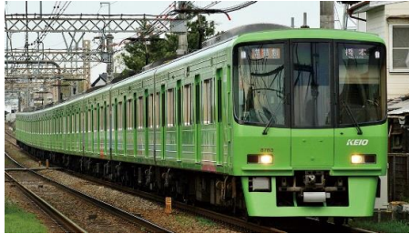
京王電鉄商品化許諾申請中

京王8000系は、京王の車両の中では初のVVVFインバータ制御を採用した車両で、1992年から1999年にかけて10両編成14本・8両編成13本が製造されました。6000系の後継車として特急や準特急を中心に使用され、現在でも京王の主力車両となっています。先頭車のデザインは、丸みを帯びた半流線型となり、5000系のイメージを踏襲しています。登場当初は、方向幕部は0番台が幕式・20番台がLED式を採用していましたが、2008年に改造工事が行われ、全車両がフルカラーLEDとなりました。またパンタグラフについても、当初は菱形パンタグラフでしたが、現在では全ての編成がシングルアーム式に換装されています。