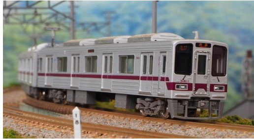
東武鉄道商品化許諾済

東武30000系は、営団半蔵門線(現東京メトロ半蔵門線)と東急田園都市線との相互直通運転対応車両として誕生しました。 2003年の相互直通運転開始とともに本来の役割を演じてきましたが、2006年に50050型が登場し相互直通運用に入ると、順次地上線(伊勢崎線・日光線)での運用に就きました。地下鉄半蔵門線との相互運用は10両編成のところ、当初は東武伊勢崎線内の検修設備の制限から6両+4両の10両編成で登場しました。 2012年3月に東京スカイツリーが開業し、同時に東武グループの新しいロゴマークが制定され、車体側面の戸袋部分に表示されています。