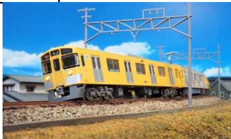
写真は池袋線仕様の試作品です。 西武鉄道株式会社商品化許諾申請中

2000系の増備車として1988年に登場した「新2000系」は、それまで投入されてきた2000系から外観が一新され、314両の一大グループを形成する西武通勤車の代表形式です。2両、4両、6両、8両とバラエティに富んだ編成を組み、新宿線および池袋線で活躍中です。近年では戸袋窓の閉鎖、ベンチレーターの一部撤去、シングルアームパンタへの装備変換など外観をさらに変化させる更新工事を施工したうえで運用に就いています。