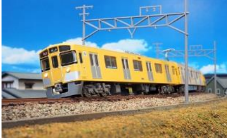
写真は試作品です。