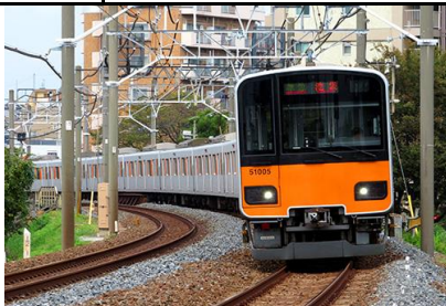
東武鉄道商品化許諾済

東武50000型は、2005年から東上線で運用されている東武初のアルミ車体の20m4扉の通勤車です。アルミ無塗装の車体に、前面窓下には塗装で、戸袋にはシール貼付によりオレンジ色が配されています。 最初の51001編成は、正面非貫通で前面窓は大型ガラス1枚とされ、側面窓も1枚ガラスの固定窓で登場しました。51002編成からは前面に非常用貫通扉がオフセットして設けられ、これに伴い前灯／尾灯の位置も変更されています。さらに、51003編成からは、側面窓が車端部を除き2分割開閉可能となりました。