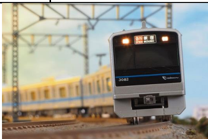
写真は試作品です。 小田急電鉄商品化許諾申請中

小田急3000形は、2001年度以降運用されている車両で、従来車に対して車体構造を大幅に見直し、一層のコスト削減と環境負荷の低減、バリアフリーの推進等を図る車両として登場し、年次改良を加えつつ増備が進み小田急通勤車では最大勢力になりました。 当初は6両固定編成と8両固定編成で登場しましたが、2010年以降は10両編成化のための中間車のみが増備されています。