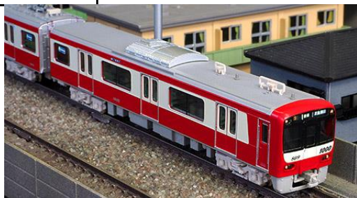
写真は試作品です。