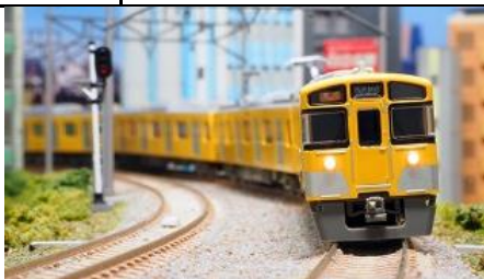
写真は試作品です。 西武鉄道株式会社商品化許諾申請中

西武新2000系は、2000系のモデルチェンジ車として1988年に登場した車両で、2両固定編成～8両固定編成まで様々なバリエーションがあり、2000系各グループとの併結による長編成の運用が見られます。2000系初期車との違いは、戸袋窓が復活し側面窓の天地寸法が拡大され1枚下降式となっています。 前期形は当初新宿線に投入され、その後前面スカート取付、一部車両のパンタグラフ撤去及びシングルアームパンタグラフへの交換、ベンチレータ撤去などが行なわれています。 その後に製造された後期形とは、大きさの異なる側面窓が特徴です。