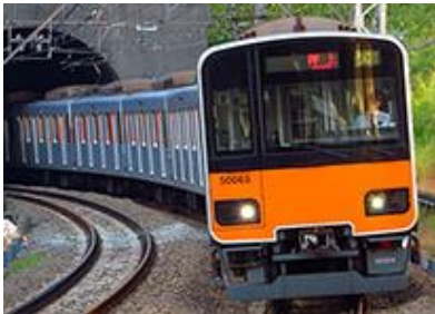
東武鉄道商品化許諾済

東武50000型は、東武通勤車として初のアルミ車体を採用し、バリアフリー・省エネルギー・メンテナンスフリー化を目指した次世代車両として2004(平成16)年に登場しました。2006年からは伊勢崎(東武スカイツリーライン)～地下鉄半蔵門線乗入車として50050型が登場しました。専ら地下鉄乗入車として運用されています。新製時から地下鉄乗入対応機器を備えていた一部の編成を除き、それまでの地下鉄乗入車30000系から機器を移設して運用されています。