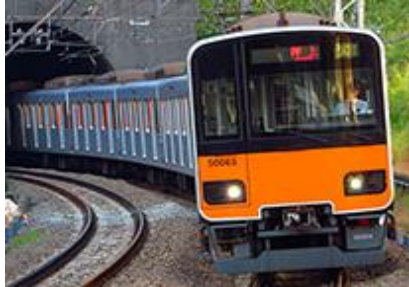
東武鉄道商品化許諾済

東武50000型は、東武通勤車として初のアルミ車体を採用し、バリアフリー・省エネルギー・メンテナンスフリー化を目指した次世代車両として2004(平成16)年に登場しました。2006年からは伊勢崎(東武スカイツリーライン)～地下鉄半蔵門線乗入車として50050型が登場しました。専ら地下鉄乗入車として運用されています。新製時から地下鉄乗入対応機器を備えていた一部の編成を除き、それまでの地下鉄乗入車30000系から機器を移設して運用されています。