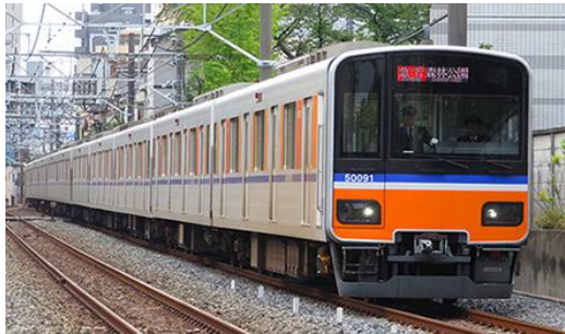
東武鉄道商品化許諾申請中

東武50000型は、東武通勤車として初のアルミ車体を採用し、バリアフリー・省エネルギー・メンテナンスフリー化を目指した次世代車両として2004(平成16)年に登場しました。2006年からは伊勢崎(東武スカイツリーライン)～地下鉄半蔵門線乗入車として50050型が、2007年からは東上線～地下鉄有楽町・副都心線乗入車として50070型が登場し、2008年には東上線の運転開始された座席定員制列車「TJライナー」用車両として50090型が登場しました。 50090型は関東では初のクロスシート/ロングシート転換方式を採用し、「TJライナー」ではクロスシートで、TJライナー以外の通常列車ではロングシートで運用されます。