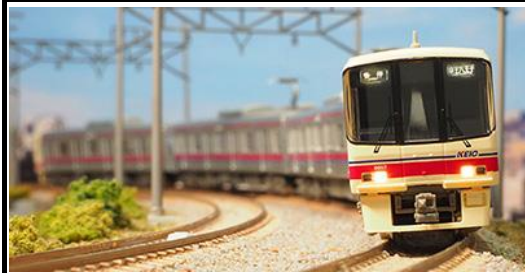
写真は試作品です。 京王電鉄商品化許諾申請中

京王8000系は、京王の車両の中では初のVVVFインバータ制御を採用した車両で、1992年から1999年にかけて10両編成14本・8両編成13本が製造されました。6000系の後継車として特急や準特急を中心に使用され、現在でも京王の主力車両となっています。先頭車のデザインは、丸みを帯びた半流線型となり、5000系のイメージを踏襲しています。登場当初は、方向幕部は0番台が幕式・20番台はLED式が採用されていましたが、2008年に改造工事が行われ、全車両がフルカラーLEDとなりました。また、当初は菱形パンタグラフでしたが、現在では全ての編成がシングルアーム式に換装されています。