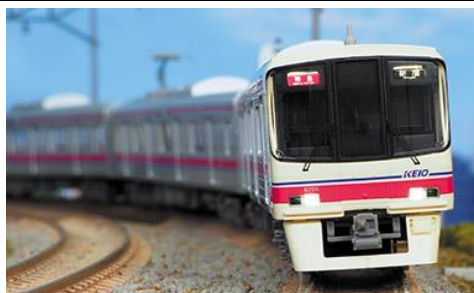
京王電鉄商品化許諾済

京王8000系は、京王の車両の中では初のVVVFインバータ制御を採用した車両で、1992年から1999年にかけて10両編成14本・8両編成13本が製造されました。6000系の後継車として特急や準特急を中心に使用され、現在でも京王の主力車両となっています。先頭車のデザインは、丸みを帯びた半流線型となり、5000系のイメージを踏襲しています。登場当初は、方向幕部は0番台が幕式・20番台はLED式が採用されていましたが、2008年に改造工事が行われ、全車両がフルカラーLEDとなりました。また、当初は菱形パンタグラフでしたが、現在では全ての編成がシングルアーム式に換装されています。2014年からは、10両編成の中間運転室を撤去し、クハからサハへと車番変更、ドアの交換、車内内装の変更等の大規模改修が行なわれています。中でも8005編成は、丸型LED前照灯を試験的に採用しているのが特徴です。