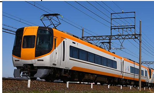
近畿日本鉄道(株)商品化許諾申請中

近鉄22000系ACEは、新世代の特急車両として1992年に登場した車両で、21000系や26000系の高貴な内装デザインを踏襲しつつ、座席構造の一新、バリアフリー対応設備の導入、乗降扉にプラグドア採用、ボルスタレス台車やVVVFインバーター制御の導入等、内外装のデザインから車両性能等全てにおいて従来の近鉄特急車両とは一線を画す設計思想の下で製造された車両です。 2015年11月からリニューアル工事が実施され、喫煙室の設置と新しい近鉄特急色に塗色変更されています。4両編成車に引き続き2両編成車のリニューアルも進められています。 2018年2月現在、近鉄線の大阪難波～近鉄名古屋や賢島～近鉄名古屋を中心に活躍しています。