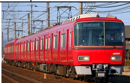
※製品は前4両です。 名古屋鉄道株式会社商品化許諾済

3500系は、それまでの通勤形車両6000系列(6000・6500・6800系)の後継車両として1993年に登場した車両で、VVVFインバータ制御、電気指令式ブレーキ、ワンハンドルマスコンの初採用、高速性能の向上による120km/h走行の実現など新機軸が盛り込まれた高性能通勤車として活躍している名鉄の主力車両です。車体は6500系に準じた普通鋼製の3扉ロングシートで、前面にはスカートが取り付けられています。また、電気指令式ブレーキ装備車であることを示す「ECB」ロゴが前面に貼付されています。 2017年から本格的な更新工事が実施され、制御機器の更新の他行先表示器のフルカラーLED化、ドアチャイムの設置、車内案内表示器の更新などが行なわれています。