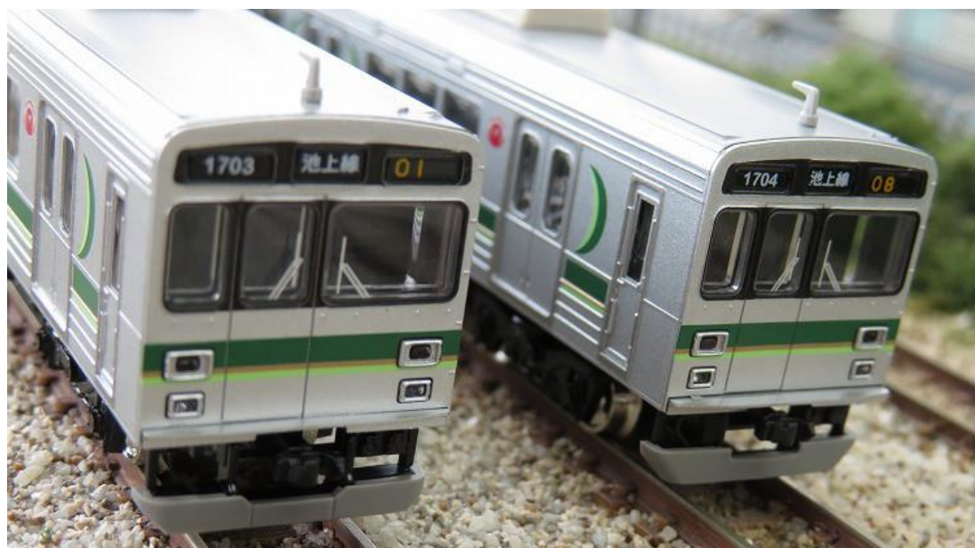
(左) 従来型スカート (右) 強化型スカート