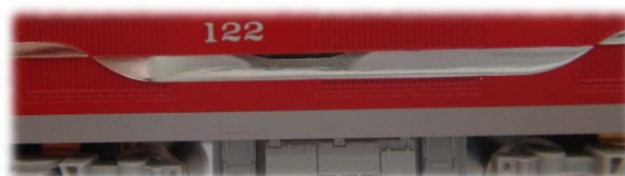
▲飾り帯は彫刻と銀色で表現