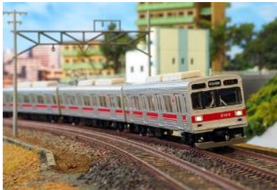
写真は前回製品です。 東京急行電鉄株式会社商品化許諾済

東急電鉄2000系は、1992年に田園都市線の輸送量増強のために新造された車両です。1986年に登場した9000系をベースに設計・製造され、東京メトロ半蔵門線乗入対応の装備を持ち、室内の改良、乗り心地の向上が図られました。93年に8両編成1編成が東横線に暫定投入されましたが、同年中に中間車2両を組み込み10両編成化のうえ田園都市線に転属しました。近年、スカートの取り付け、方向幕・前照灯のLED化が進められました。