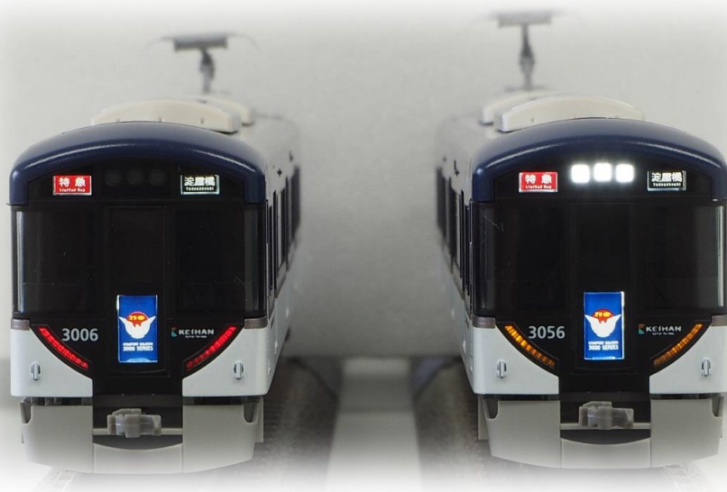
▲ヘッドマーク・テールライト点灯時