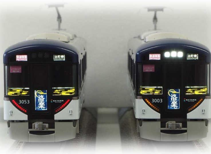
▲ヘッドライト・テールライト点灯 ▲ヘッドマークも点灯！