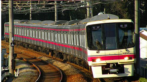
京王電鉄商品化許諾済

京王8000系は、京王の車両の中では初のVVVFインバータ制御を採用した車両で、1992年から1999年にかけて10両編成(6両+4両)14本・8両編成13本が製造されました。6000系の後継車として特急や準特急を中心に使用され、現在も京王を代表する主力車両となっています。 2005年までにパンタグラフがシングルアーム化され2008年頃までには方向幕がフルカラーLED化されています。 8032編成と8033編成は他の編成と異なるボルスタレス台車を装備しており、製品は客扉が大規模改修車と同様の窓がやや小ぶりなものに交換された8032編成をプロトタイプとしています。