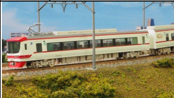
名古屋鉄道株式会社商品化許諾済

1700系は、1996年に登場した1600系をルーツとしており、2008年の特急車体系の見直しに伴い1600系のも1700型とサ1650型を分割し、これにク1600型の機器を一部流用するなどして新造された2300系(一般車)4両を合わせた6両編成となり1700系として誕生しました。 2015年8月、1701編成を皮切りにかつての1600系を彷彿とさせる塗り分けに変更され、その後残る編成も順次新塗装化されました。