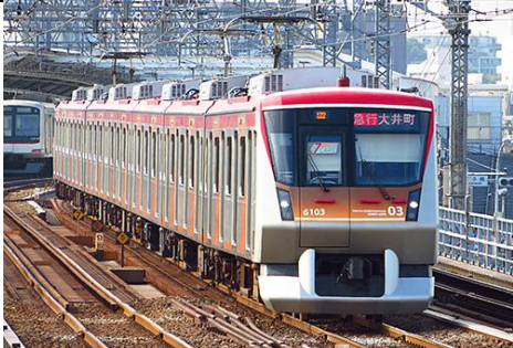
東京急行電鉄株式会社商品化許諾済

東急6000系は、2008年大井町線の急行運転開始に併せて導入された急行専用車両です。当初6両編成で運用に就いていましたが、輸送力増強のため中間車を1両追加して7両編成となりました。 前頭部は特徴的なくさび形デザインを採用しつつ、非常用貫通路をオフセットして配置している外、ライトの配置やラインカラーのデザインにも従来の東急車とは異なるテイストが込められています。