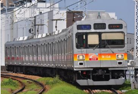
東京急行電鉄株式会社商品化許諾済

東急9000系は、1986年から導入された東急初のVVVF制御を採用した車両で、東横線に8両編成が14本、大井町線に5両編成が1本投入されました。車体は、東急の標準的な切妻20m車ながら、将来の地下鉄乗入を想定して前面に非常用貫通路がオフセットして設置されているのが特徴です。 2009年度から大井町線への転属が進んでいましたが、2013年3月に東横線と東京メトロ副都心線の相互直通運転開始を機に東横線での運用が終了し、全編成が5両編成化されて大井町線に転属となりました。大井町線への転属に併せてパンタグラフがシングルアーム化されるとともに、前面への大井町線カラーのグラデーション帯と側面への大井町線ステッカーが貼付されました。