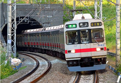
東京急行電鉄株式会社商品化許諾済

東急8590系は、軽量ステンレス車体の8090系をベースに1988年に製造された車両で、三つ折の前面に貫通扉が設置されています。当初は東横線に投入されましたが、その後大井町線に転属となり、一部が田園都市線へ活躍の場を移しました。2014年にはスカートが設置され、連結面車端部に転落防止のために注意喚起の黄色テープが貼付されました。