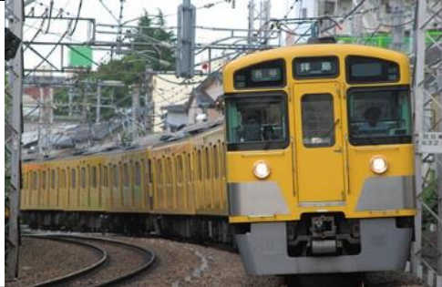
西武鉄道株式会社商品化許諾済

西武新2000系は、2000系のモデルチェンジ車として1988年に登場した車両で、2両固定編成～8両固定編成まで様々なバリエーションがあり、2000系各グループとの併結による長編成で運用が見られます。2000系初期車との違いは、戸袋窓が復活し側面窓の天地寸法が拡大され1枚下降式となっています。前期形には前面貫通扉窓が大型化されているグループもあります。 前期形は当初新宿線に投入されました。新製後間もなく前面スカートが取り付けられ、その後4両編成のクモハのパンタグラフが撤去されました。2012年以降ベンチレータ撤去工事も進められています。 その後もリニューアル工事が施され、現在でも西武鉄道全線で活躍する主力車両となっています。