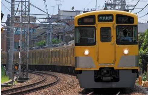
西武鉄道株式会社商品化許諾済

西武新2000系は、2000系のモデルチェンジ車として1988年に登場した車両で、2両固定編成～8両固定編成まで様々なバリエーションがあり、2000系各グループとの併結による長編成で運用されています。2000系初期車との違いは、戸袋窓が復活し側面窓の天地寸法が拡大され1枚下降式となっている他、初期グループでは前面貫通扉窓も小型化されているのが特徴です。 前期形は当初新宿線に投入されました。新製後間もなく前面スカートが取り付けられ、その後4両編成のクモハのパンタグラフが撤去されました。2012年以降ベンチレータ撤去工事も進められています。 その後もリニューアル工事が施され、現在でも西武鉄道全線で活躍する主力車両となっています。