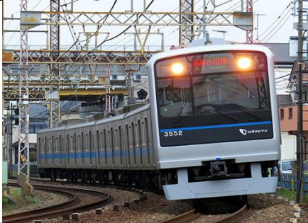
小田急電鉄商品化許諾済

小田急3000形は2001年度以降運用されている車両で、車体構造の見直しにより一層のコスト削減と環境負荷の低減、バリアフリー化の推進を図った車両です。2600形から2000形まで続いた側面の裾絞り構造を改め直線構造とした車体となりました。 1次車は、運転室に隣接する箇所を除いた客扉が1600mm幅の両開きとなり、戸袋窓が設置されているのが特徴です。 その後、新宿方先頭車の電気連結器が2段に改造され、前面帯が細帯化、前面・側面にブランドマークが付きさらに近年帯色がインペリアルブルーに変更されています。