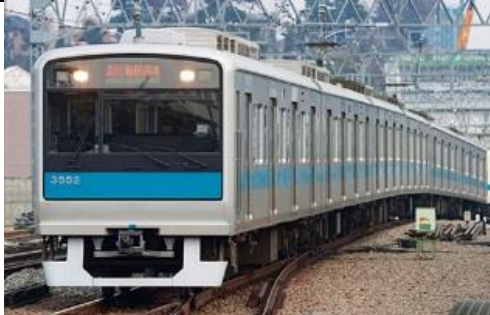
小田急電鉄商品化許諾申請中

小田急3000形は2001年度以降運用されている車両で、車体構造の見直しにより一層のコスト削減と環境負荷の低減、バリアフリー化の推進を図った車両です。2600形から2000形まで続いた側面の裾絞り構造を改め直線構造とした車体となりました。 1次車は、運転室に隣接する箇所を除いた客扉が1600mm幅の両開きとなり、戸袋窓が設置されているのが特徴です。 登場時は前面窓下に青色の太帯が配されていました。