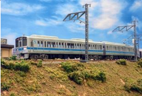
小田急電鉄商品化許諾済

小田急1000形は1988年に初のステンレス車体やVVVF制御を採用し登場した車両で、小田原線をはじめ江ノ島線・多摩線へと幅広く運用されており、かつては地下鉄乗入れの直通運転にも充当されていました。4両～10両編成のパラエティに富んだ編成があり、近年ではリニューアル車両も登場しています。製品は6両の1251編成と4両の1069編成を、ブランドマークが付いた現在の姿で再現します。両編成を組み合わせることで実物同様に4+6の10両編成が組成できます。