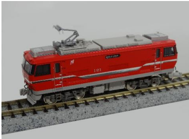
写真は試作品です。