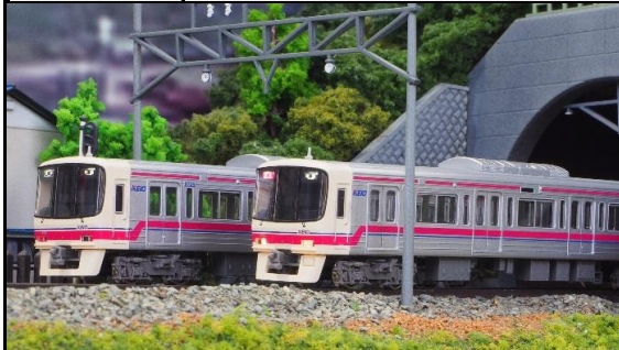
京王電鉄商品化許諾済

京王8000系は、京王の車両の中では初のVVVFインバータ制御を採用した車両で、1992年から1999年にかけて10両編成14本・8両編成13本が製造されました。6000系の後継車として特急や準特急を中心に使用され、現在でも京王の主力車両となっています。先頭車のデザインは、丸みを帯びた半流線型となり、5000系のイメージを踏襲しています。登場当初は、方向幕部は0番台が幕式・20番台はLED式が採用されていましたが、2008年に改造工事が行われ、全車両がフルカラーLEDとなりました。また、当初は菱形パンタグラフでしたが、現在では全ての編成がシングルアーム式に換装されています。2014年からは、10両編成の中間運転室を撤去し、クハからサハへと車番変更、ドアの交換、貫通扉交換、車内内装の変更等を行う、大規模改修が行なわれています。製品は、大規模改修が行われ、種別・行先方向幕がフルカラーLED化、中間の先頭車から運転室を撤去し、車両番号が変更された姿を再現しています。