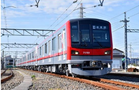
東武鉄道商品化許諾済

東武70000系は東武スカイツリーラインから東京メトロ日比谷線に直通運転する車両で、将来のホームドア導入を見据え仕様の共通化を図るため日比谷線の20m車化と併せて製造されました。 20m4扉で、アルミ車体にLED照明、VVVF制御等最新の東武車両との共通化を図ったほか、操舵台車や永久磁石同期電動機等の最新技術を導入し、曲線通過性能の向上や走行時の騒音低減、省エネルギー化を目指しています。