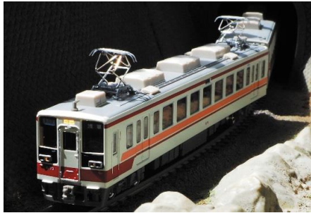
東武鉄道商品化許諾済

東武6050系は6000系の車体更新によって登場した2扉セミクロスシート車両で、1985年から1986年にかけて2両編成22本が更新により登場しました。更新途中に車両が不足することから完全新造編成が1985年に1編成、1986年に1編成、1988年に増備(これらの2編成は野岩鉄道へ譲渡)され、その後は7編成および野岩鉄道向けの1編成が増備、1990年には会津鉄道向けに1編成が製造されています。完全新造編成は台車がSUミンデン型台車になっている点が特徴です。1996年には増解結の効率化を図るため、先頭部の連結器が、自動連結器から電気連結器付き密着連結器へ交換され、前面向かって左側に取り付けられていたジャンパ栓受けが撤去されています。2001年3月のダイヤ改正から日光線の普通列車で運用される事となり、5編成に霜取り用パンタグラフが増設されました。また、2006年の区間快速の登場に合わせて完全新造車2編成に追加で霜取りパンタグラフが増設されています。