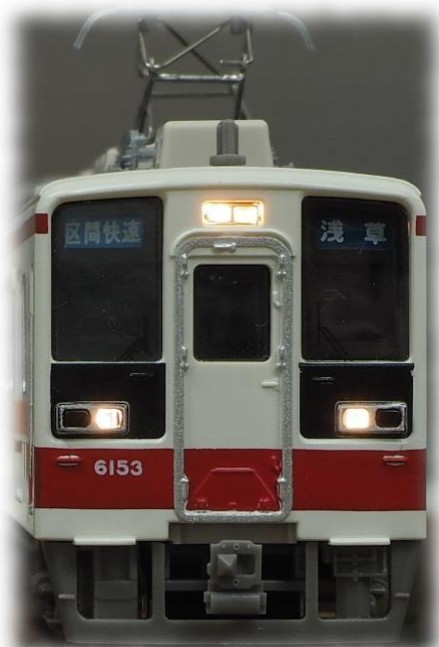
▼東武グループロゴも精密再現