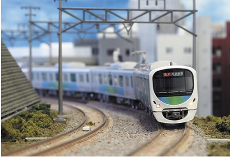
西武鉄道株式会社商品化許諾済

西武30000系は2008年に営業運転を開始した通勤形電車です。西武鉄道の通勤形電車としては初の拡幅断面形状の車体を採用しているのが特徴です。内外装のデザインについては「たまご」をモチーフとし、外観は「生みたてのたまごのようなやさしく、やわらかなふくらみ」を、内装は「温かみのあるやさしい空間」をそれぞれイメージしたもので「スマイルトレイン」の愛称で親しまれています。基本となる8両固定編成と増結用の2両固定編成があり、最大10両編成で運転されています。2013年度の増備車より10両固定編成が落成し、池袋線・新宿線で活躍しています。