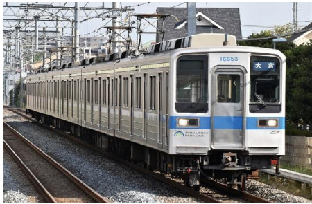
東武鉄道商品化許諾申請中

東武10050型は、東武10030型をベースに1992年(平成4年)以降製造されたグループで、屋上通風器の廃止と連続した冷房装置カバーが外観の特徴です。2、4、6両固定編成があり、他系列の車両とも併結して運用されています。東武野田線転属後は併結運用が無いため、貫通幌の取り付け金具や前面の渡り板が撤去され、帯色が青色(フューチャーブルー)と黄緑(ブライトグリーン)に変更され、イメージが変わりました。「TOBU URBAN PARK LINE」のロゴが前面と先頭車側面に貼り付けられ、現在ではホーム検知装置が設置されています。