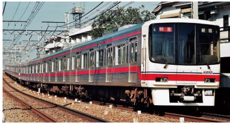
写真: 志賀 拓史 京王電鉄商品化許諾申請中

京王8000系は、京王の車両の中では初のVVVFインバータ制御を採用した車両で、1992年から1999年にかけて10両編成14本・8両編成13本が製造されました。6000系の後継車として特急や準特急を中心に使用され、現在でも京王の主力車両となっています。先頭車のデザインは、丸みを帯びた半流線型となり、5000系のイメージを踏襲しています。登場当初は、方向幕部は0番台が幕式・20番台がLED式を採用していましたが、2008年に改造工事が行われ、全車両がフルカラーLEDとなりました。また、パンタグラフについても、当初は菱形パンタグラフでしたが、現在では全ての編成がシングルアーム式に換装されています。