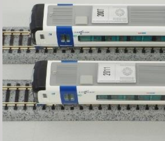
写真奥:改造編成 写真手前:新造編成