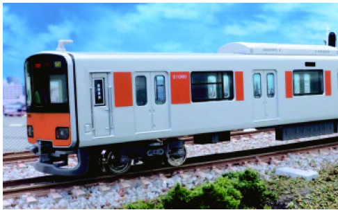
東武鉄道商品化許諾済

50050型は、2006年に東京地下鉄半蔵門線・東京急行電鉄田園都市線乗り入れ対応車両として伊勢崎線に投入された車両で、前期形は側面窓ガラスが固定式で登場したものを、2012年10月中旬ごろから一部を開閉式に改造されて運用されています。 製品は、前期形グループのうち51060編成を、側面窓が車両中央を除き開閉可能に改造され車体側面の社紋が新ロゴマークに変更された姿をモデル化。お買い求めやすいよう、基本と増結の2パッケージに分けて製品化します。