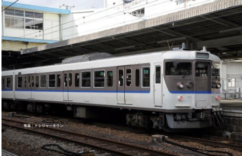
JR西日本商品化許諾済

JR西日本の115系2000番台は1998年から2009年にかけて体質改善40N工事が施工され、車体の大規模更新と車内設備の大幅なリニューアルが実施されました。側面窓ガラスの支持方式の変更やベンチレーターの撤去、張り上げ屋根への改造等が外観上の特徴です。更新時には白色系の地に窓周りと裾に茶色を配し、窓下に青色の帯を纏った更新色に塗られて登場しました。2009年からは順次中国地域色(黄色)に変更が進んでいます。製品は更新色に塗られて運用されていた2014年頃のL-11編成(基本セット)とL-07編成(増結セット)をプロトタイプにモデル化しました。