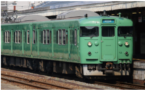
JR西日本商品化許諾済

JR西日本で活躍する113系のうち、状態の良い車両を対象に1998年から車体の大規模更新と座席の交換をはじめとする体質改善40N工事が施工されました。屋根の張り上げ化、ベンチレーターの撤去、側面窓ガラスの支持方式の変更や黒色サッシ化されている点が外観上の特徴です。薄茶色の塗装色をベースに、窓周りを茶色で塗り分け、同社のコーポレートカラーの青色のラインが入った更新色でカラーリングも一新されました。2009年からは地域に合わせた単色塗装に塗装変更されることとなり、順次更新色から地域色に塗装変更されています。基本セットは京都地域色(緑単色)に塗装変更された京都総合運転所所属L16編成を、増結セットは同じくL17編成をプロトタイプにモデル化しました。