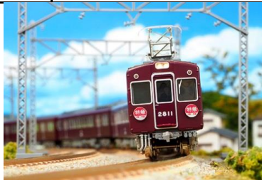
写真は試作品です。