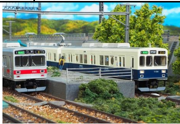
写真は試作品です。

上田電鉄1000系は、2008年3月に元東急1000系を譲り受け、ワンマン化、パンタグラフのシングルアームタイプへの換装と増設等の改造により登場した車両です。VVVF制御装置、ボルスタレス台車などの近代的な装備が特徴で、現在までに4編成が導入されています。 1004編成は、2015年3月に2代目「まるまどりーむ号」として濃紺とクリーム色のツートンカラーに一部が楕円形の側窓に改造され、特別協賛の株ミキエンジニアリングによる「Mimaki」ラッピングが施されています。