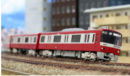
写真は前回製品です。